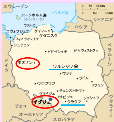
ポズナン・ザブジェ市の位置

② 高崎市はポーランドのポズナン市との交流を進めています。本公演は高崎市の後援によりポズナンの合唱団とのジョイントコンサートを通して、当合唱団が目的としている世界平和に貢献するイベントです。