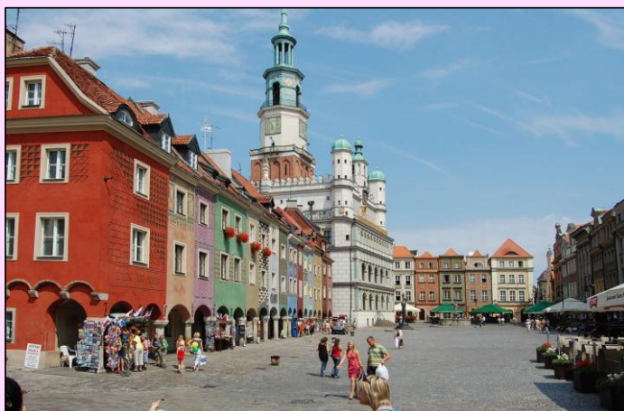
ポズナン市庁舎周辺の街並み